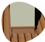
ÉTANCHÉITÉ DES CHEMINÉES