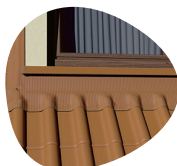
ÉTANCHÉITÉ DES MENUISERIES ET CHIENS-ASSIS